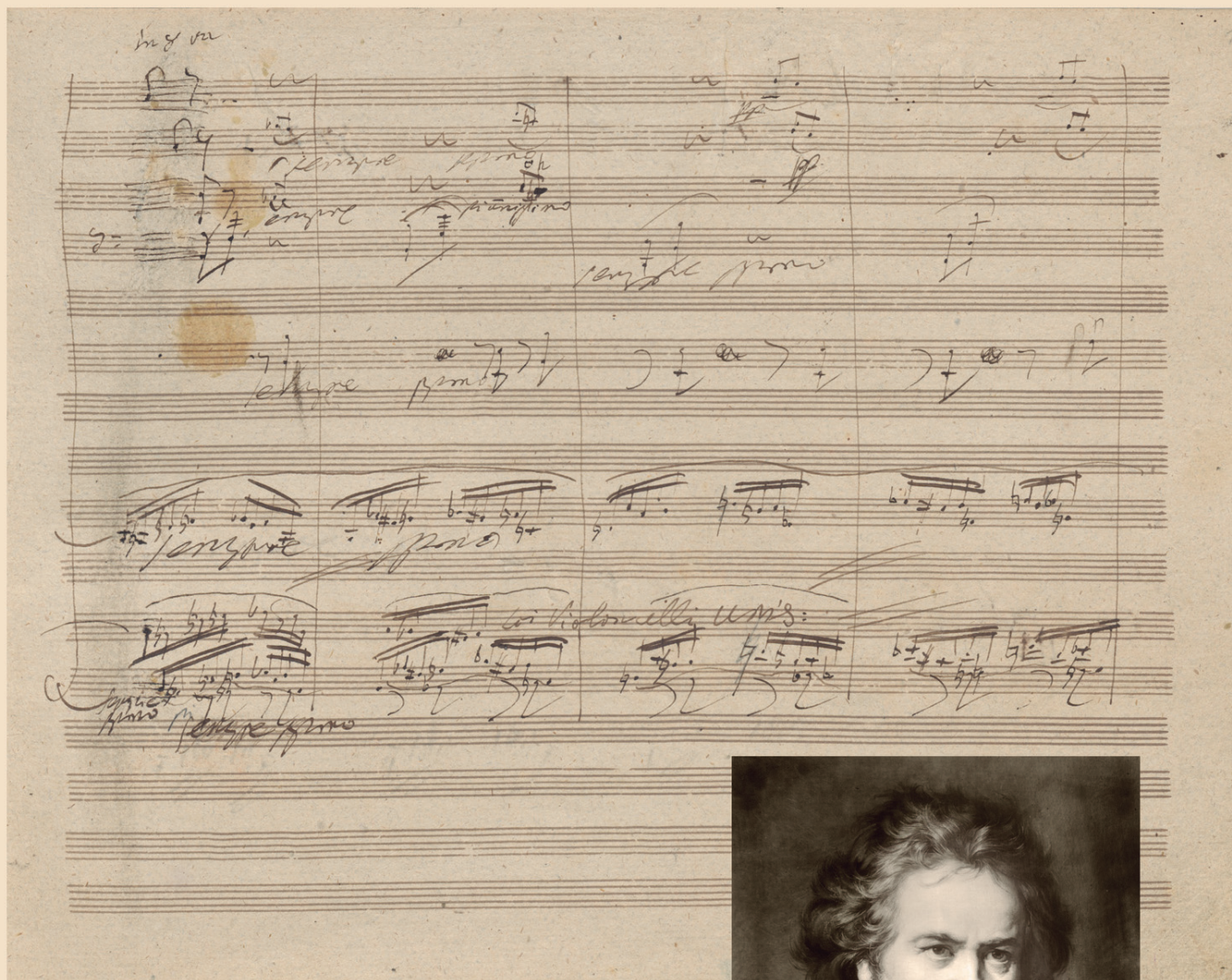
Página 12 de la partitura autógrafa. Sinfonía n.º 9 en re menor, op. 125, conocida como Coral, Ludwig van Beethoven entre 1822 y 1824. (Biblioteca Estatal de Berlín).